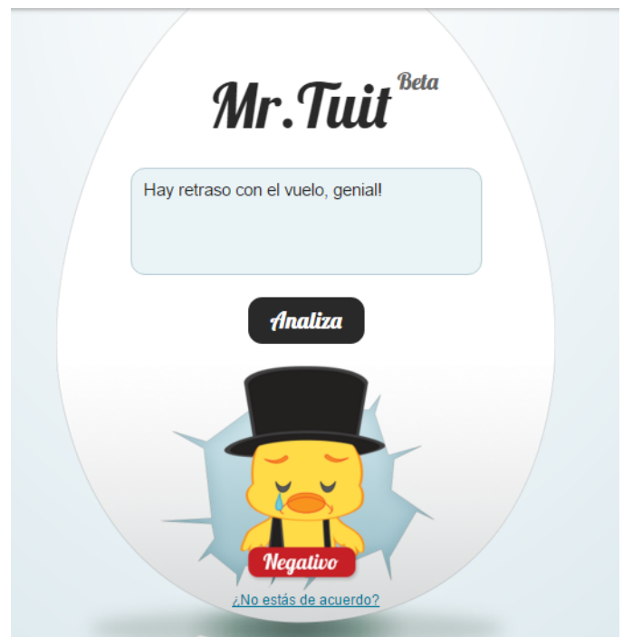
Figura 1. Mr Tuit: Sistema de Análisis de Sentimientos. Por InfoMrTuit .