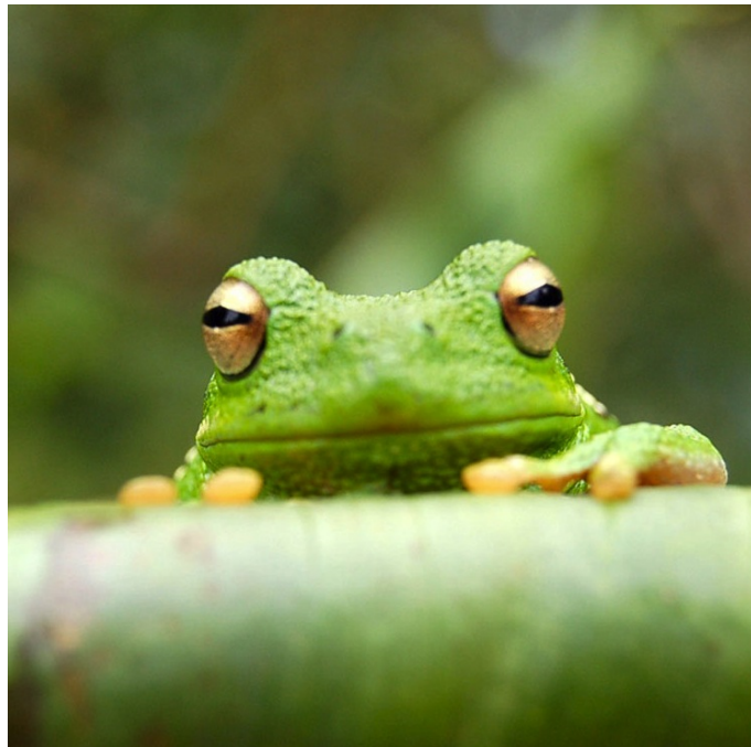
Figure 2.1: Frog pic...

Here is a reference to the from pic: Figure 2.1.