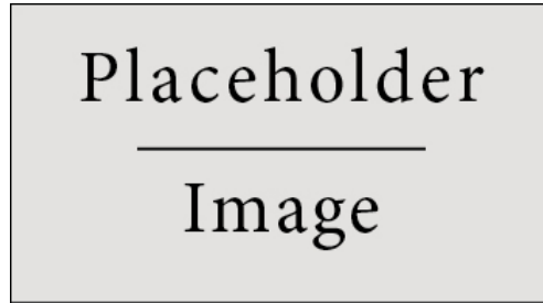
Figure 1: An example of simple figure.

sed ultricies auctor, pede lorem egestas dui, et convallis elit erat sed nulla. Donec luctus. Curabitur et nunc. Aliquam dolor odio, commodo pretium, ultricies non, pharetra in, velit. Integer arcu est, nonummy in, fermentum faucibus, egestas vel, odio.