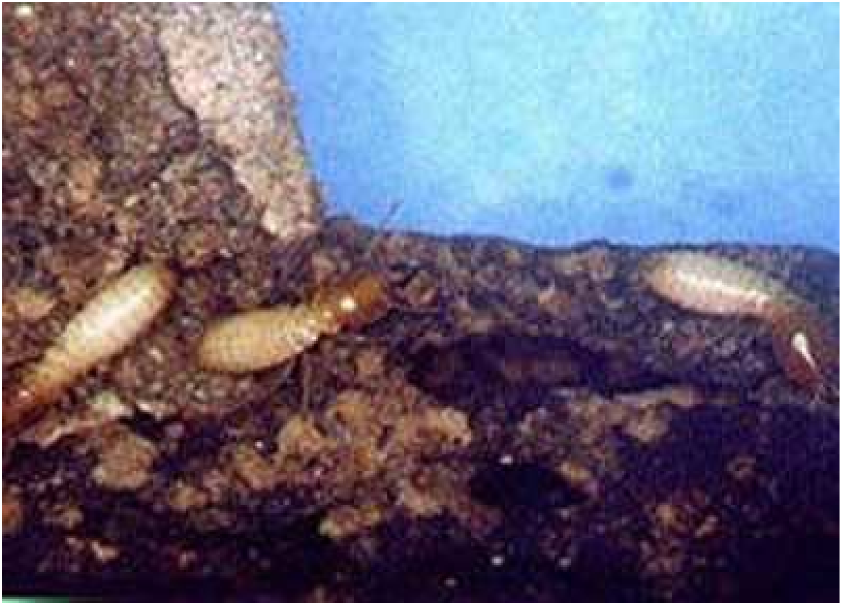
FIGURA 1.2 – Exemplo real de cupim frente ao seu dilema.

Segundo, o critério de otimização utilizado será o acoplamento entre as juntas do manipulador e neste caso, temos um sistema redundante quando ocorre falha de uma das juntas do manipulador de três juntas, e seu posicionamento é controlado pelas duas restantes. Nossa solução para o problema é baseada na formulação de redundância local, extensivamente estudada no contexto de cinemática inversa (nakamura). A principal contribuição deste trabalho é a extensão deste método usando as equações dinâmicas de manipuladores subatuados e a utilização do índice de acoplamento como um critério para a minimização do torque e da energia gasta pelo sistema durante o controle das juntas falhas.