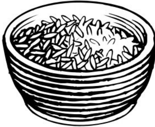
Figure 3.1: A bowl of rice.

urna porta tincidunt. Mauris felis odio, sollicitudin sed, volutpat a, ornare ac, erat. Morbi quis dolor. Donec pellentesque, erat ac sagittis semper, nunc dui lobortis purus, quis congue purus metus ultricies tellus. Proin et quam. Class aptent taciti sociosqu ad litora torquent per conubia nostra, per inceptos hymenaeos. Praesent sapien turpis, fermentum vel, eleifend faucibus, vehicula eu, lacus.