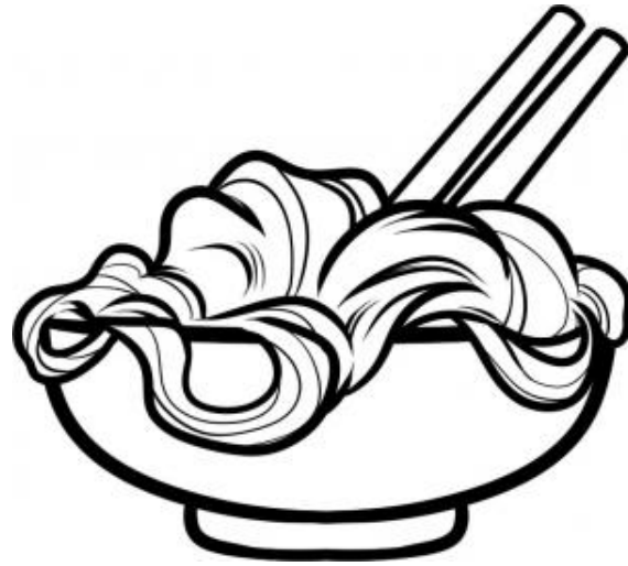
Figure 4.1: A bowl of noodles.

urna porta tincidunt. Mauris felis odio, sollicitudin sed, volutpat a, ornare ac, erat. Morbi quis dolor. Donec pellentesque, erat ac sagittis semper, nunc dui lobortis purus, quis congue purus metus ultricies tellus. Proin et quam. Class aptent taciti sociosqu ad litora torquent per conubia nostra, per inceptos hymenaeos. Praesent sapien turpis, fermentum vel, eleifend faucibus, vehicula eu, lacus.