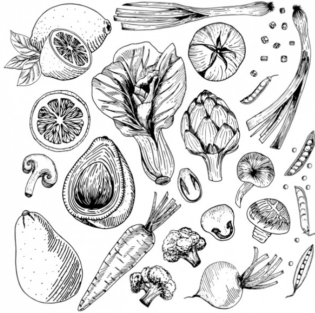
Figure 1.1: A collection of food.