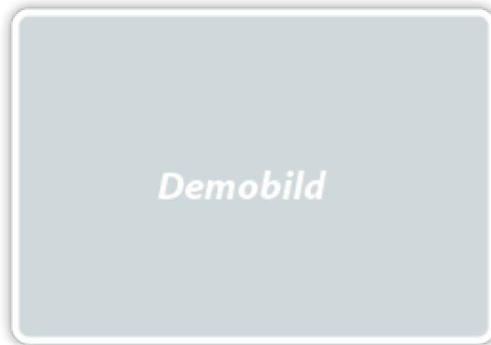
Abbildung 1: Einzelne Bilder wie dieses sollten zentriert auf der Seite platziert werden. Auf eine sinnvolle Größe ist ebenso zu achten, wie auf eine konkrete Beschreibung der Abbildung.

Sed consequat tellus et tortor. Ut tempor laoreet quam. Nullam id wisi a libero tristique semper. Nullam nisl massa, rutrum ut, egestas semper, mollis id, leo. Nulla ac massa eu risus blandit mattis. Mauris ut nunc. In hac habitasse platea dictumst. Aliquam eget tortor. Quisque dapibus pede in erat. Nunc enim. In dui nulla, commodo at, consetetuer nec, malesuada nec, elit. Aliquam ornare tellus eu urna. Sed nec metus. Cum sociis natoque penatibus et magnis dis parturient montes, nascetur ridiculus mus. Pellentesque habitant morbi tristique senectus et netus et malesuada fames ac turpis egestas. Verweis auf das Bild 1.